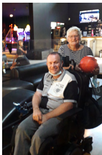
Une sortie Bowling pour les jours de pluie