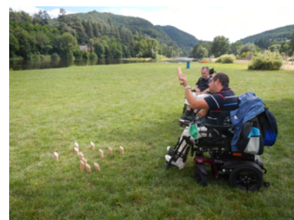
Une partie de quille en bois à Aurec sur Loire