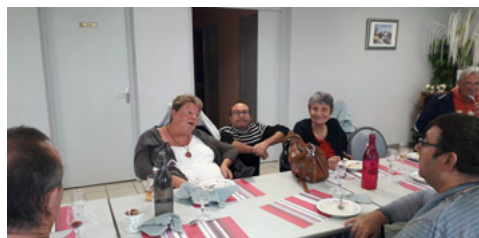
Le groupe de Montbrison au restaurant La Bruyère