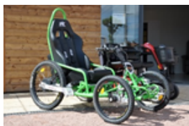
Photo du quadrix de la boutique APF Tech'Service 42 au Coteau.

Et n'hésitez pas à les contacter pour toutes questions ou demande d'informations à : pf-aventure.aura@apf.asso.fr